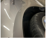
Sol Ön Çamurluk

Detay: Aracın Muhtelif Yerlerinde Ezik ve Çizikler Var, KAPI CİVATALARINDA AYAR MEVCUT,